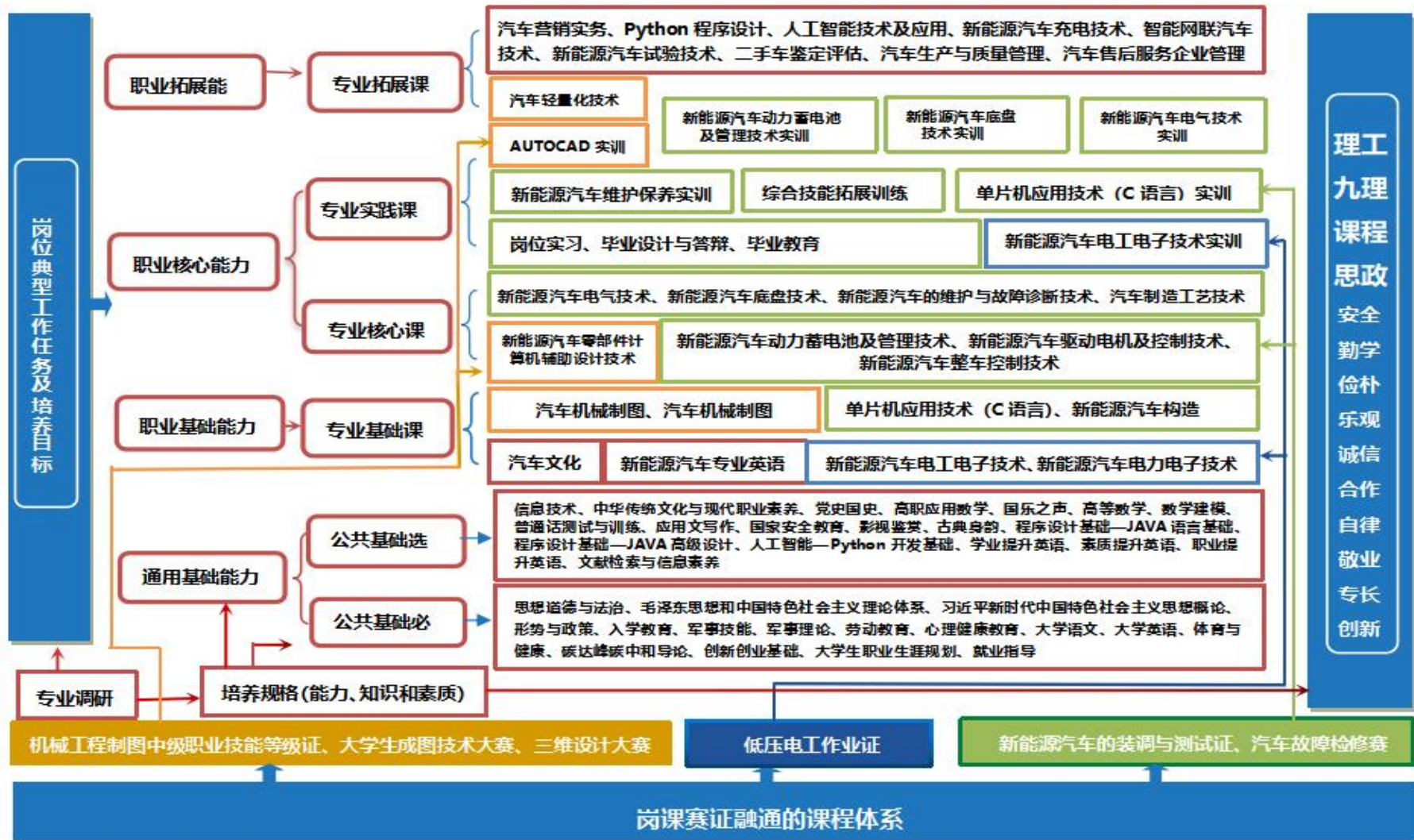
图 1 课程体系